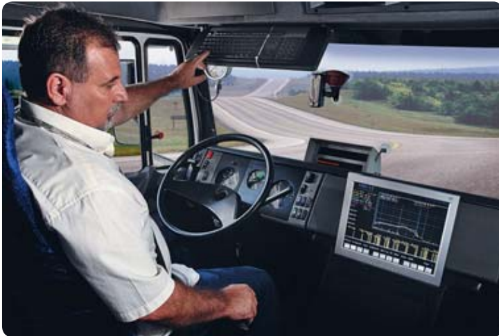
O caminhão é equipado para testes em campo

Para um veículo rodar, o sistema de freio precisa ser homologado e estar de acordo com as normas da Associação Brasileira de Normas Técnicas (ABNT). Quando uma montadora desenvolve um novo produto, que exige uma nova aplicação de freio, ou seja, com características diferentes das já existentes, o sistema de freio é revisto pela Master para que atenda as respostas de frenagem.