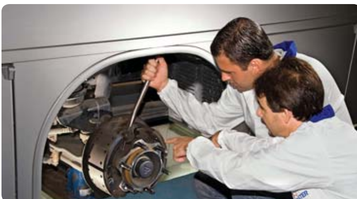
Participantes acompanham processo de fabricação

A agenda do Programa de Capacitação Master já está publicada no site www.freiosmaster.com . A cada dois meses a empresa desenvolve o treinamento de equipes técnicas e comerciais, com o objetivo de informar sobre as novidades tecnológicas dos produtos, novos desenvolvimentos e mercado de autopeças.